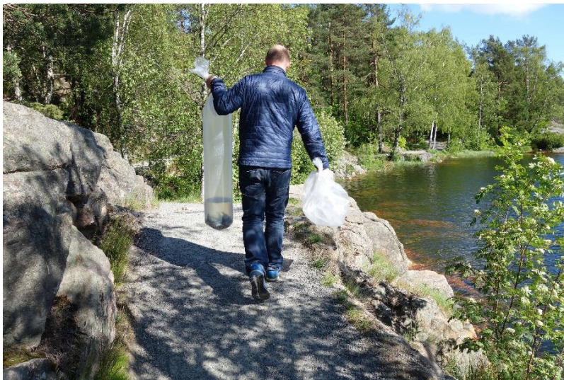
Figur 1 Fiskeutsetting 3. Stampe

Kalkingsaktivitet avsluttet etter avtale med fagmyndighet i Kristiansand Kommune. Vannkvaliteten i flere vann er nå så god at naturlig reproduksjon er i gang. Også i år ble det foretatt utfisking med ruser og garn. Det er fisket opp ca 100 gyteklar fisk i Bjortjønn og Storemyrvann. Målinger viser at kvaliteten på fisken er i klar bedring. Det ble tatt fisk på 5-600 gram. Det har nå vært foretatt utfisking i nevnte vann i 7 år. Utfisking i Jegersbergvannet, ca 2-300 abbor. Noen ål som ble satt ut igjen. Det ble satt ut fisk i 3 vann (3. Stampe, Kyrstjønn og Krogvann), til sammen 300 stk ørret fra Syrtveit Fiskeanlegg.